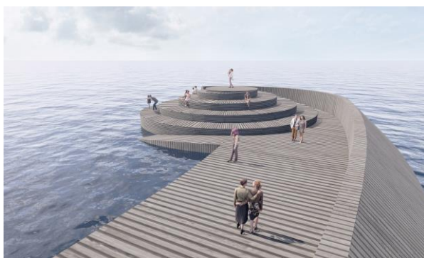
Spiralen yderst på molen giver udsigt og siddepladser

Skal man til/fra husbådene, vil man sandsynligvis gå nede på den lave flydebro, som bliver et slags fortov langs husbådene, og giver god adgang uanset vandstanden.