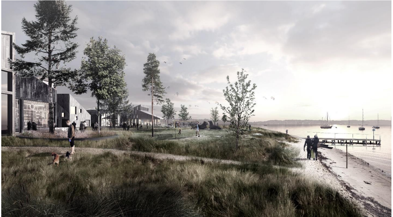
Marinaparken ud mod fjorden, tæt på husbådene

Nyt om bl.a. projektstatus, tidsplan, lejekontrakt, priser og hvordan man udvælges til en plads.